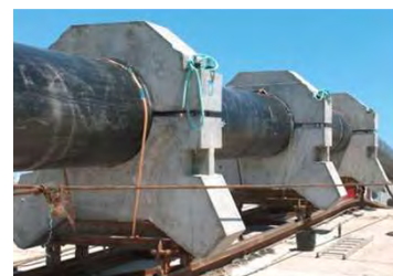
Lançamento da tubagem e vista durante a construção. Pipe launching and Construction in progress.