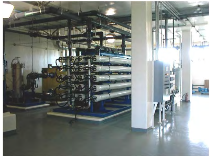
Baterias de membranas Membrane stacks

O projecto foi executado em regime chave-na-mão e incluiu a construção civil, procura e montagem de todo o equipamento específico, electro-mecânico, dispositivos de instrumentação e controlo remoto, assim como todos os testes de arranque. Após a construção, a empresa assegurou ainda a exploração e condução técnica da instalação.