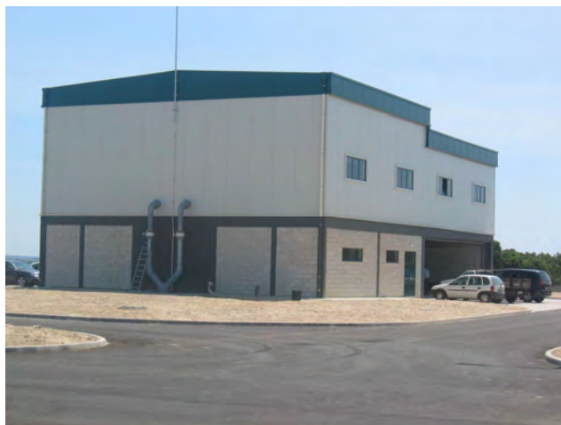
Vista do edifício de tratamento de águas residuais View of WTP building

Design-build construction of a water treatment facility for the EPAL in Vale da Pedra (Azambuja). Works included all civil construction, procurement and installation of all specific, mechanical, electrical and control equipment and pre-engineered systems, as well as all commissioning tests. After construction the WTP has capacity to grant 400.000 m 3 /day of treatment flow.