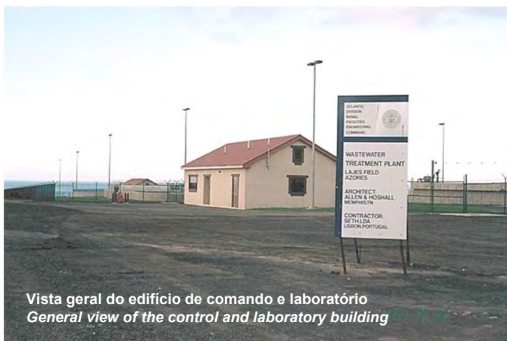
Vista geral do edifício de comando e laboratório General view of the control and laboratory building

Construction of a WWTP for the US Navy at Lajes Field, Azores (Portugal). Design was made by a US engineering firm. Construction was done on a turn-key basis and included all works: civil works, procurement and expediting of all electrical, mechanical and control equipment, as well as all commissioning and start up operational tests. Also included in the contract was the construction and furnishing of the laboratory building. Scope also included the construction of a piping network about 6 km long, manholes and 3 pumping stations.