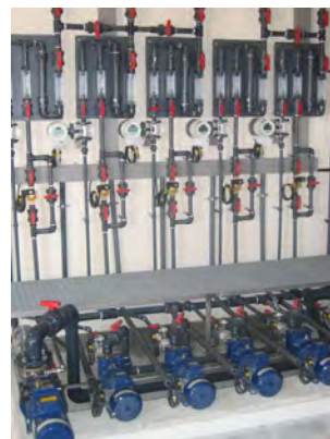
Diversas vistas do equipamento instalado na central. Several views of the equipment installed in the facility.