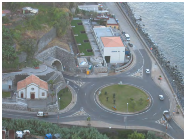
Vista geral da ETAR General view of WWTP

Turn-key construction of a waste water treatment plant for the local government at Madeira Island, in Tabua (Ribeira Brava), to 13200 inhabitants served, with a treatment flow of 3164 m 3 per day. Works included civil construction, procurement and installation of all specific, mechanical, electrical and control equipment and pre-engineered systems, as well as all commissioning tests.