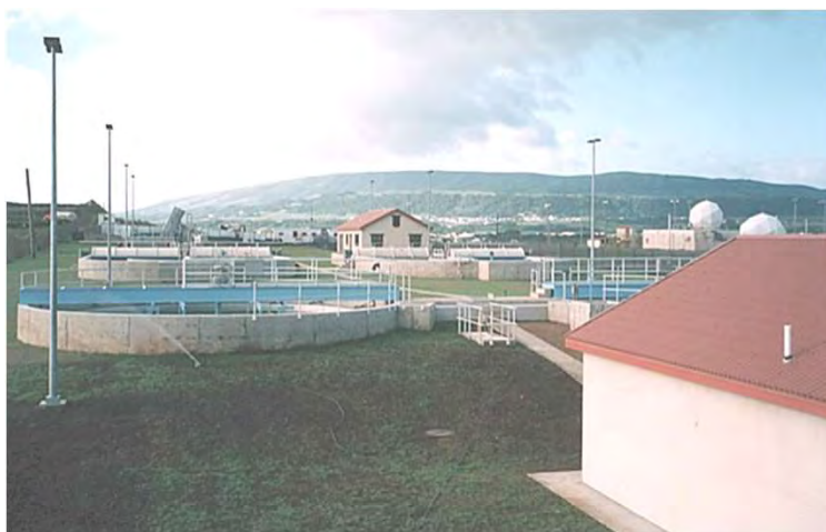
Vista geral da ETAR. Em segundo plano, os tanques de clarificação General view of the WWTP. Background: the clarifier tanks

Construção para a Marinha de Guerra dos E.U.A. de uma Estação de Tratamento de Águas Residuais na base Aérea das Lajes, Açores. Toda a instalação foi construída e equipada com base em projecto realizado nos E.U.A.. O projecto foi executado em regime chave-na-mão e incluiu a construção civil, procura e montagem de todo o equipamento electro-mecânico, dispositivos de instrumentação e controlo remoto, assim como todos os testes de arranque. O contrato integrou ainda a construção e equipamento total do laboratório de análises físico-químicas dos fluidos tratados e dos efluentes gerados pelo tratamento. Ainda parte do projecto, salienta-se a construção de uma rede de tubagens de transporte das águas residuais (com cerca de 6 km de extensão), tubagens de interceptação, câmaras de visita e 3 estações de bombagem.