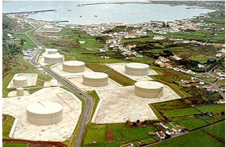
Vista aérea do Parque de Tancagem Sul na Base Aérea das Lajes. Em 2º plano, a cidade da Praia da Vitória, com o Porto Militar (esquerda) e o Porto Comercial (em cima, ao centro) The South Tank Farm at Lajes Field, Azores. In the background, the city of Praia da Vitória, the Military Harbor (left) and the Commercial Harbor (top center).