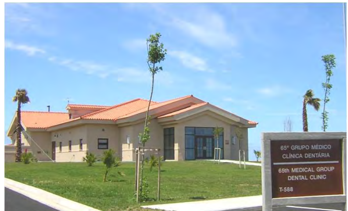
Aspecto do exterior do edifício Outside view of the Dental Clinic

Fez também parte da empreitada o fornecimento e instalação de todo o sistema de ar condicionado, ar comprimido, vacuum, oxigénio, esterilizador, som e detecção de incêndios, bem como todo o mobiliário dos consultórios, laboratório e sala de raio X.