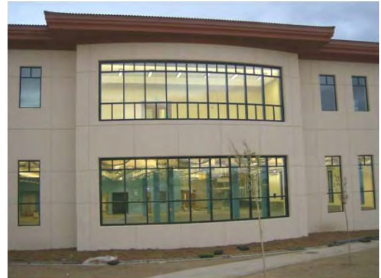
Aspecto do exterior do edifício Outside view of the Fitness Center

Para além das “tradicional” especialidades como águas, esgotos, electricidade e comunicações, também fez parte da empreitada o fornecimento e instalação de um elevador, de todo o sistema de ar condicionado, som, CCTV e detecção de incêndios.