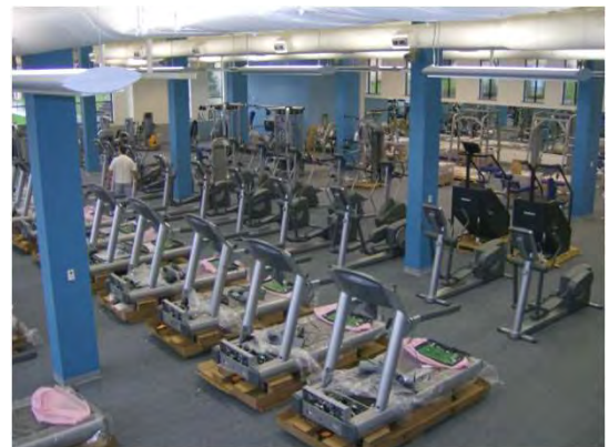
Aspecto do interior do ginásio Inside view of the gymnasium

Beside the “normal” specialties as water, drain, electrical e communications, was included in our scope of work the supply and installation of a hydraulic elevator, all the systems as: air conditioning, music, commercial intrusion detection system and fire alarm system.