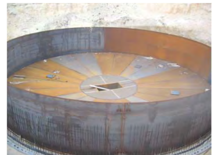
Projecto NATO 99/7PL40601